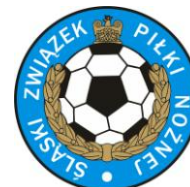
Tabela B klasa ostateczna