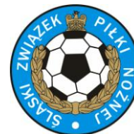
Tabela IV liga okręgowa trampkarze ostateczna